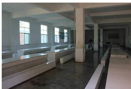
图 3 学生食堂