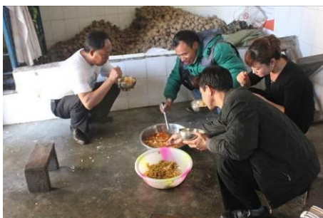
图 10 老师在厨房就餐