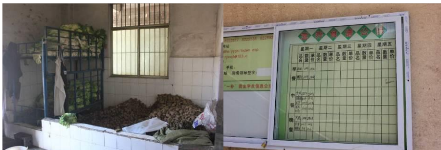
图 12 厨房堆放的土豆和白菜