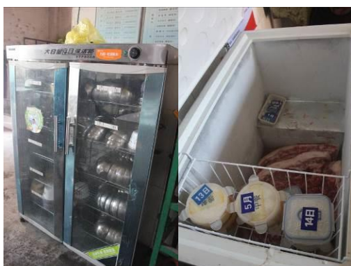
图 9 消毒柜和菜品留样