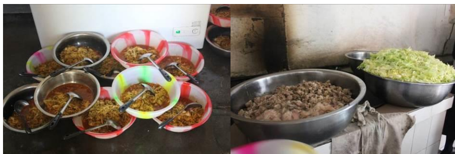
图 11 14、15 号两天学生的饭菜

学校 5 月 14 日菜谱为鸡蛋豆腐汤, 炒莲花白。5 月 15 日为回锅肉, 白菜汤。调查人员 14 日在学校就餐, 感觉菜品口感一般, 味道较单一。学校能保证中餐每日都有肉或者蛋, 有肉时开支远超过每人 3 元标准。而学校晚餐品种很单一, 不是天天有肉。据负责免费午餐的老师说学生饭量比较大, 学校原来也尝试过每天按 3 元标准做肉, 学生不够吃。现在超出的费用从学校住宿制经费中出。