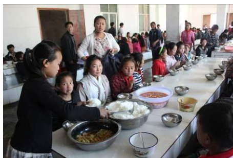
图 8 由一名学生分发饭菜

学校食堂门外有洗手池, 学生大多能自觉洗手。就餐时由学生从厨房把餐具搬到食堂, 学生自行领取, 这时秩序较乱。学生围坐在餐桌边, 由一名学生分饭菜。饭后餐具回收由厨师统一清洗消毒, 食堂由值日学生打扫卫生。由于是在底层食堂的地面很潮湿。在厨房调查人员看到了按规定进行的菜品留样, 并且每日都有消毒和留样登记。