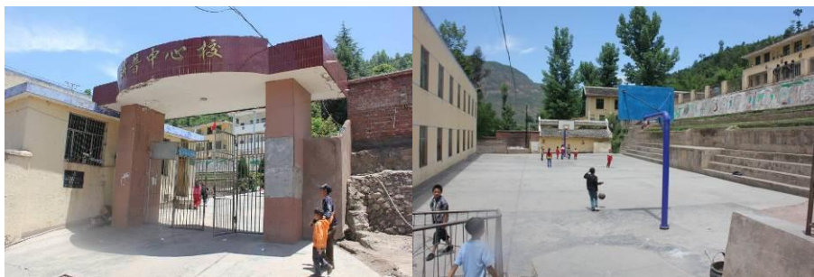
图 1 学校大门