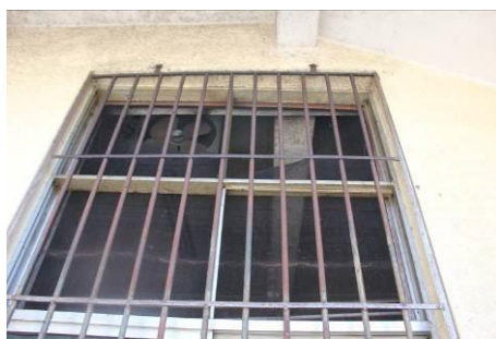
图 7 窗上的纱窗开了个口