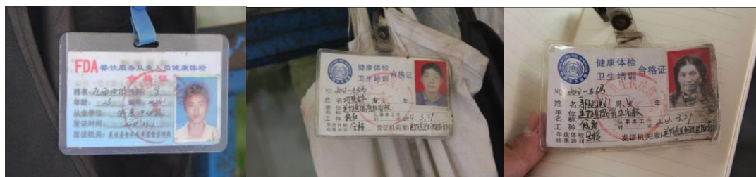
图 5 健康证