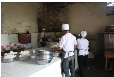
图 4 厨师穿着比较干净