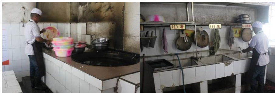
图 6 厨房的灶台和洗碗池

学校的厨房位于女生宿舍楼下，属于半地下室，房子较老，厨房中下水道在地面中间，污水直接倒在地上导致地面很湿滑。厨房门外苍蝇较多，厨房窗上的纱窗也开了一道口，有苍蝇落在盛好的饭菜上。